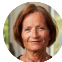
Elisabeth Epstein

värdefull i länder med bristande tillgång till gynekologer. Den bidrar till att öka den diagnostiska precisionen på ett snabbt och effektivt sätt vilket förbättrar vården för kvinnor i resurssvaga områden.