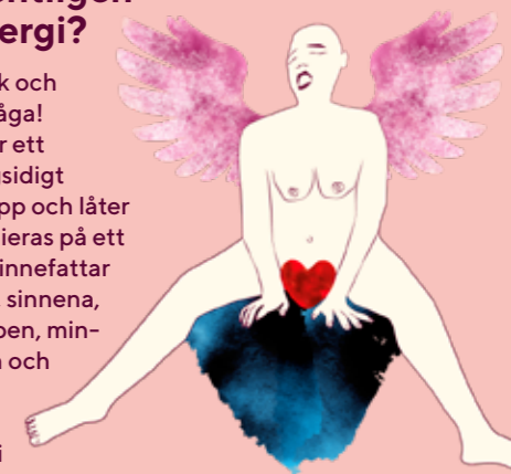
ILLUSTRATION: EVA FALLSTRÖM

Hur ofta, hur mycket och vilken sorts sexuell energi vi upplever kan variera. Självkänsla och känslan av frihet och egenmakt är viktiga faktorer i sammanhanget. ✨