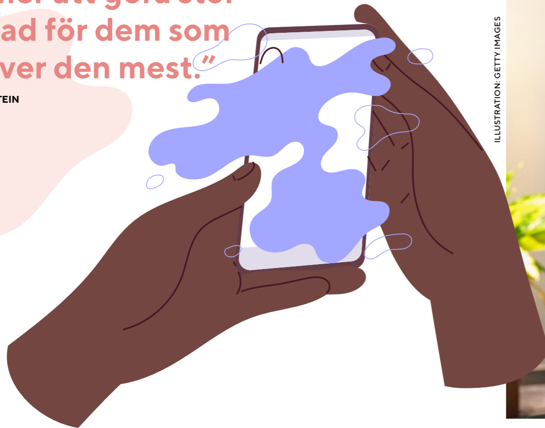
ILLUSTRATION: GETTY IMAGES